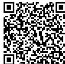
海洋及沙灘 分齡賽 網上報名表