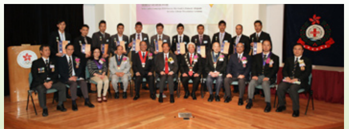
香港消防處獲救生星章人士