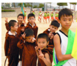
小鐵人特別動物造型(猴子)