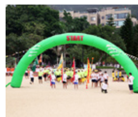
KAMACHI自備吹氣拱廊增添氣氛