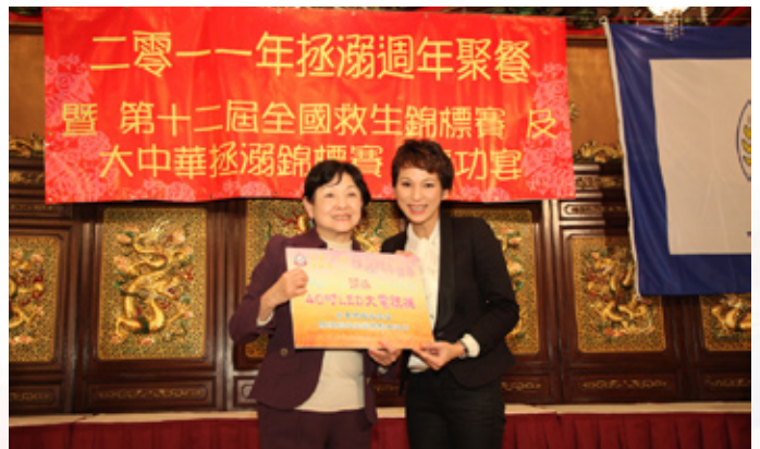
2011週年聚餐頭獎得主