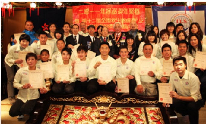
香港拯溺代表隊合照