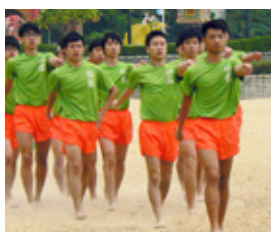
愉園體育會步操時認真及一致