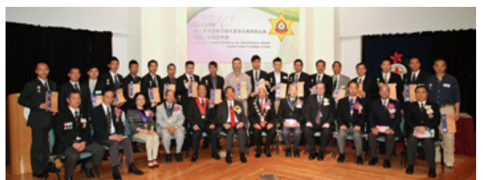
香港警務處獲救生星章人士