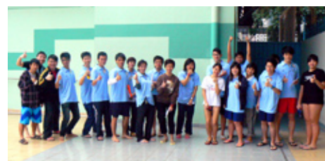
泳池實習－教練及學員合照