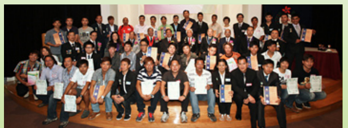
康樂及文化事務署獲救生星章及救生嘉許狀人士