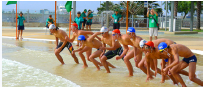
於人造浪泳池進行海浪游泳賽