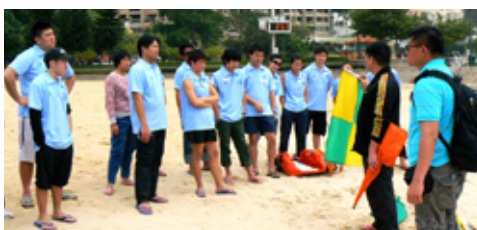
沙灘實習學員正在聽講師講解如何分別比賽旗號