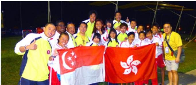
香港隊與新加坡隊大合照