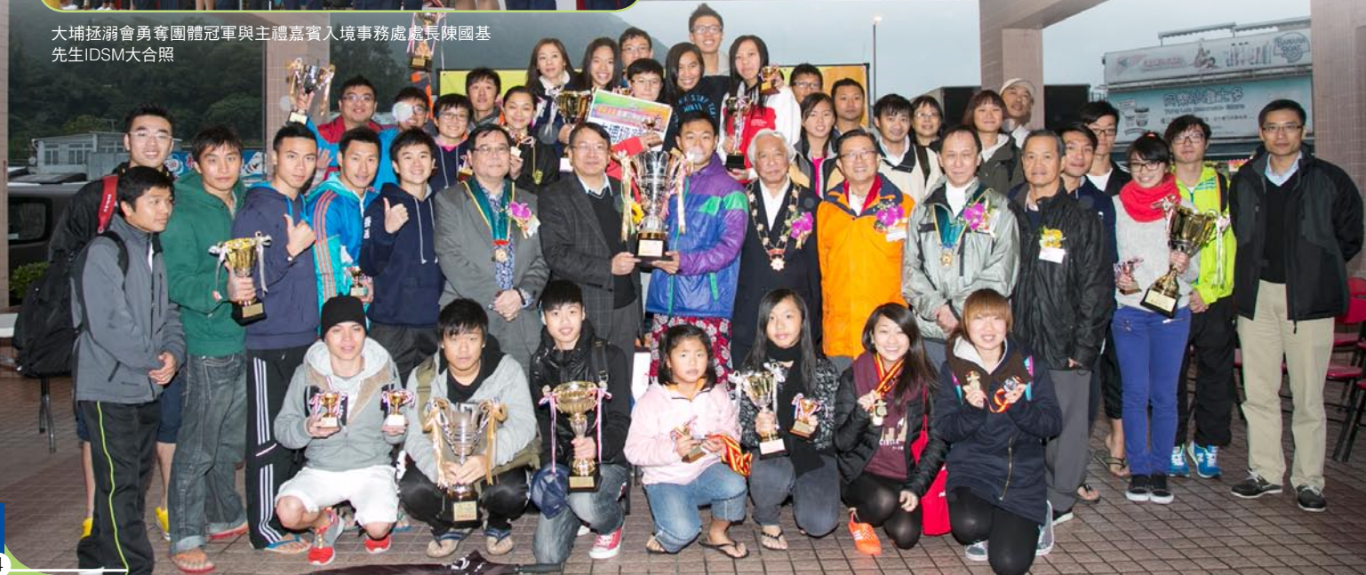
大埔拯溺會勇奪團體冠軍與主禮嘉賓入境事務處處長陳國基先生IDSM大合照