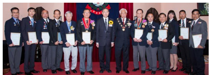
金銀海豚、榮譽功績星章、優異服務獎章、長期服務金章得獎者合照