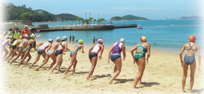
第二回合“女子海浪游”起步