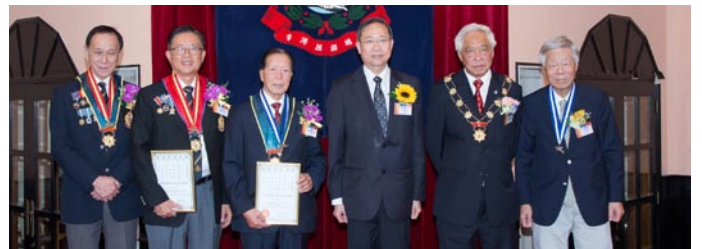
金銀海豚得獎者合照