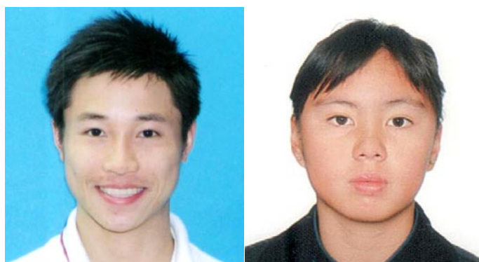
年度最佳海洋新秀運動員