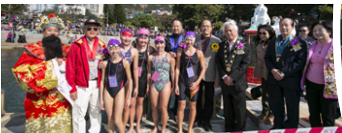
參賽者與嘉賓合照