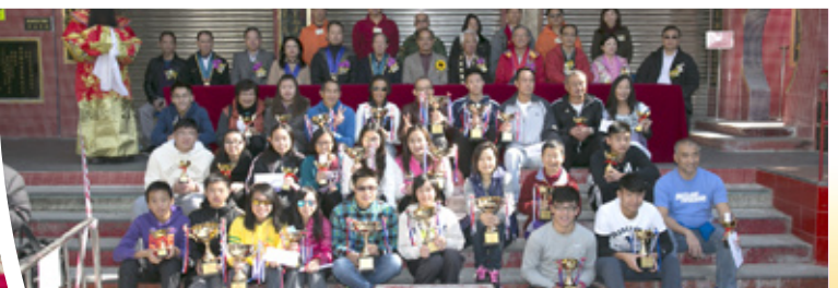
得獎者及嘉賓合照