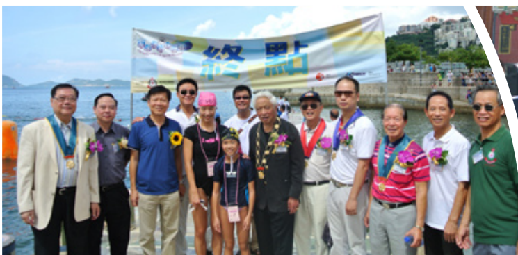
參賽者與嘉賓合照