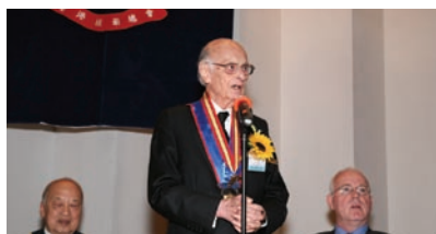
副總裁沙理士在週年講座上致辭