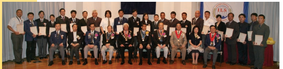
會長嘉許狀人士及各嘉賓合照