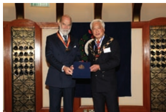
HRH Prince Michael of Kent