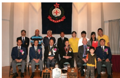
屬會救生成績得獎者合照