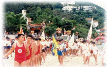
香港拯溺總會拯溺表演隊「男子組」