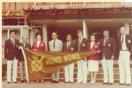
1981年6月香港代表團出席英聯邦救生會議