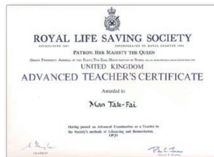
頒授自英國皇家救生會的高級拯溺教師證書(1971)