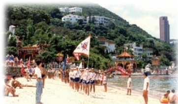
未建人工堤壩的香港拯溺總會訓練基地前灘