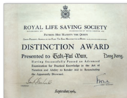
頒授自英國皇家救生會的優異章證書(1964)