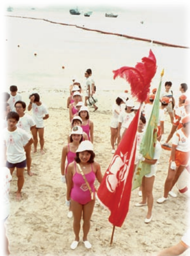
香港拯溺總會拯溺表演隊「女子組」