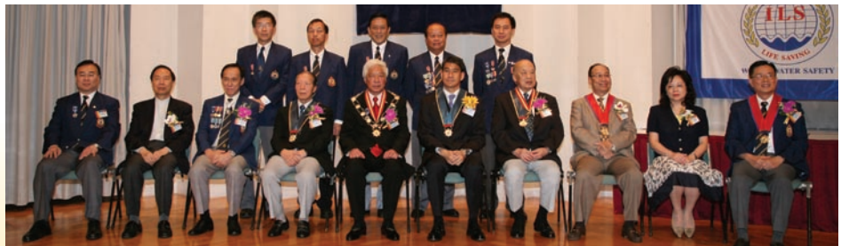
榮譽功績星章人士及各嘉賓合照