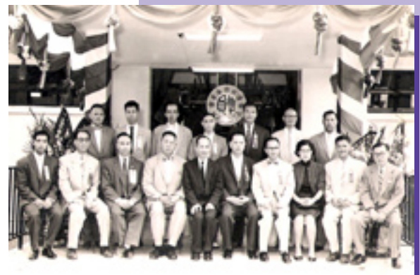
1961年韋錦潮副會長與前政府華員會服務組合照