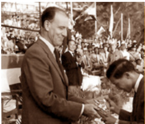
第一屆沙灘嘉年華會由柏立基總督任主禮嘉賓