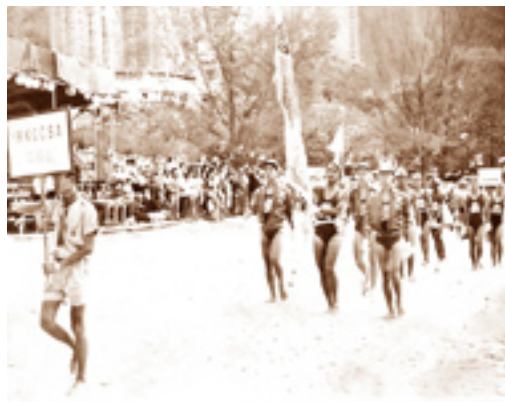
第一屆沙灘嘉年華會(沙灘大會操前身)