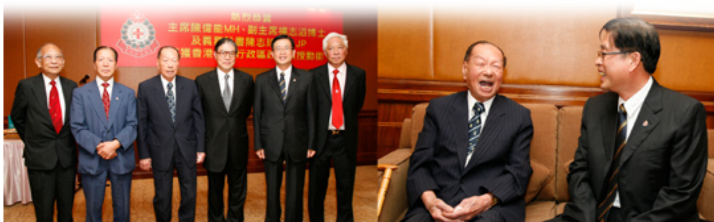
張錦添總理出席慶祝晚宴情況

張 錦添先生是香港拯溺總會其中一位創會會員，曾為總會會章之成立及水上安全作出莫大貢獻。他於1955年起加入香港拯溺會(即香港拯溺總會前身)，他曾在英國皇家救生會(香港分會)擔任當年總理(1965-1972)、考試委員會Promoter(1960-1966)、考試委員會參贊(1968-1970)，並在香港拯溺總會擔任名譽顧問(1960-1964)、全港水上安全運動主席(1963-1965)、副會長(1967-1969)、會長(1969-1970)、名譽會長(1971-1972)，自1984年起更擔任香港拯溺總會永遠總理，至今服務超過53年。他在1964年及1968年分別獲英國聯邦頒發勞績勳章及聯邦十字服務勳章。他帶領總會在過去積極發展水上安全及拯溺運動，貢獻良多。