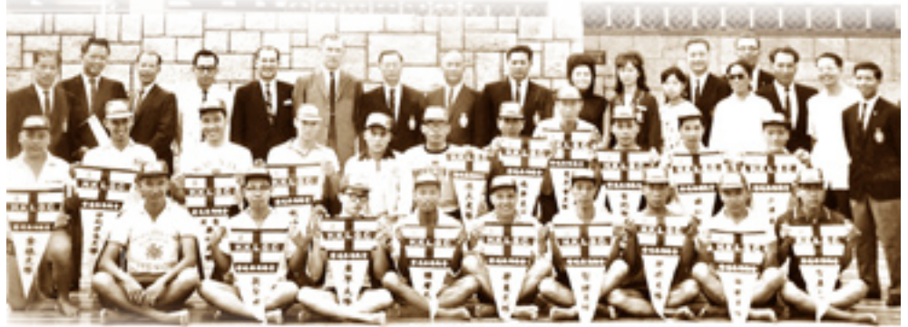
全港拯溺會隊長首次合照