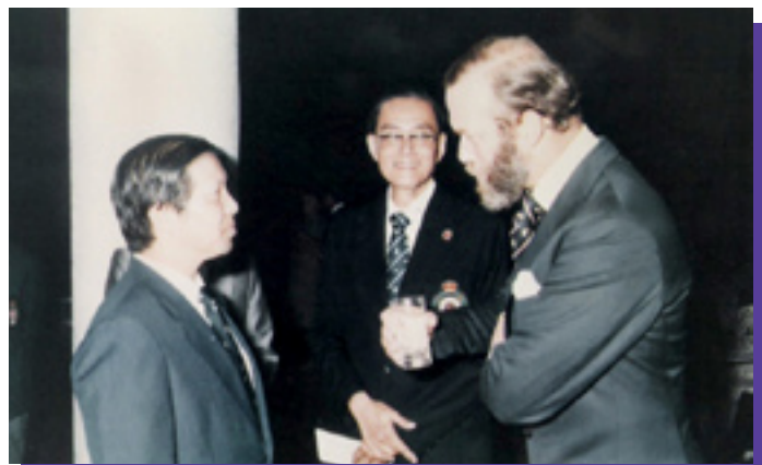
1985年韋錦潮副會長在三軍師令官邸與訪港的根德公爵會面

未有第一時間施以援手的工人，因怕事及篤信鬼神之說，不由分說地趨前掌攔遇溺男童！此等蠻