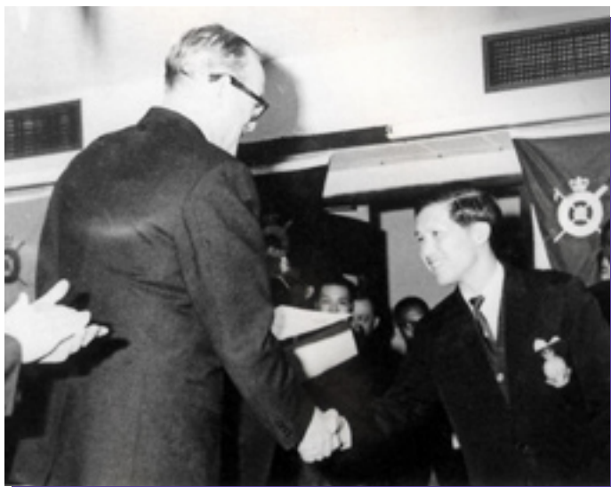
1964年戴麟趾港督接見韋錦潮副會長