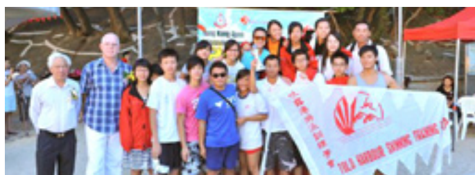
女子團體冠軍 - 匯友體育協會