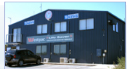
參觀位於黃金海岸附近的直昇機拯救中心