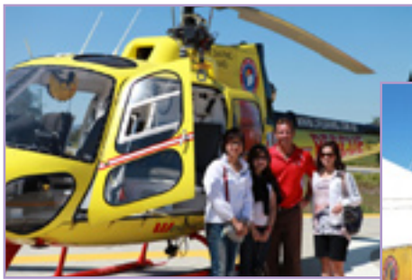
參觀位於黃金海岸附近的直昇機拯救中心