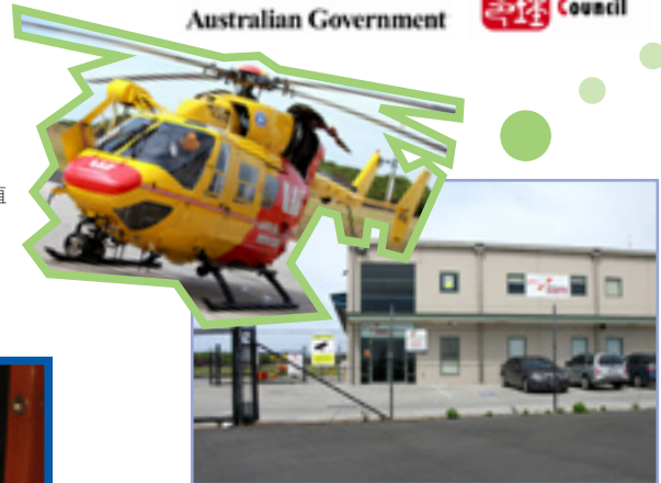
SLSA除了提供泳灘救援外，亦承辦以直昇機在海上及山上巡邏及救援服務，以義務救生員當值為主，服務十分全面。圖為位於悉尼的直昇機拯救中心。