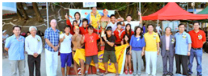
團體總冠軍 - 匯友體育協會

http://www.hklss.org.hk/public/modules/Maa/Maa_topic.asp?news_type_id=73 查閱。