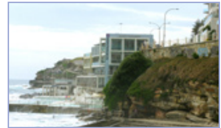
坐落於著名的澳洲悉尼邦迪海灘邊的，就是澳洲浪濤救生會總部(SLSA)