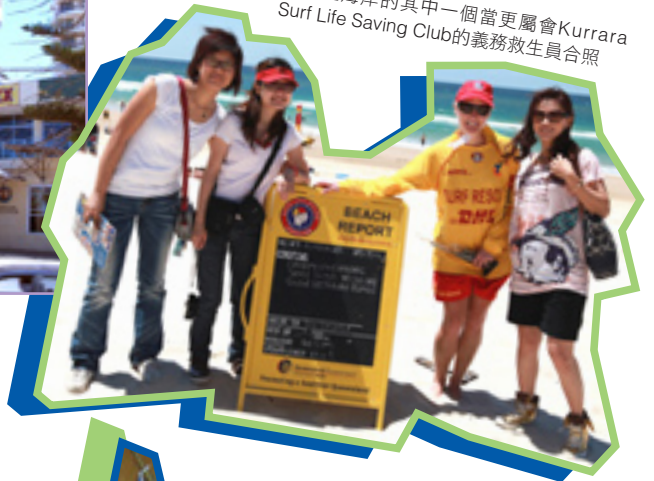
與黃金海岸的其中一個當更屬會 Kurrara Surf Life Saving Club 的義務救生員合照