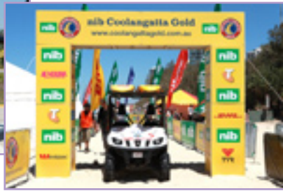
Coolangatta Gold 的比賽場地佈置