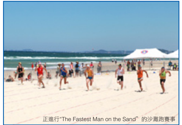
正進行“The Fastest Man on the Sand” 的沙灘跑賽事