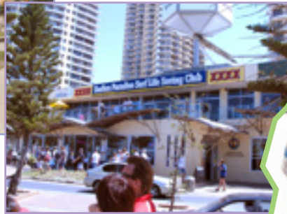
黃金海岸泳灘上其中一個當更屬會 - Surfers Paradise Surfers Life Saving Club