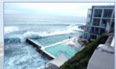
SLSA總部附兩個天然泳池(Lagoon)，利用天然海水在水漲時儲水，在澳洲的海邊是很常見的。