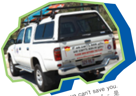
“If we can't see you, we can't save you. - Please swim between the flags” - 是 SLSA 的其中一個標語