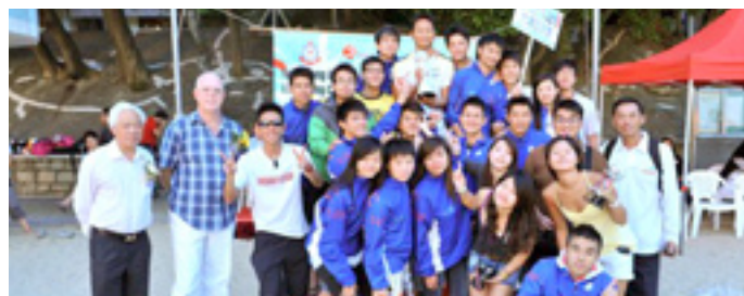
男子團體冠軍 - 大埔拯溺會