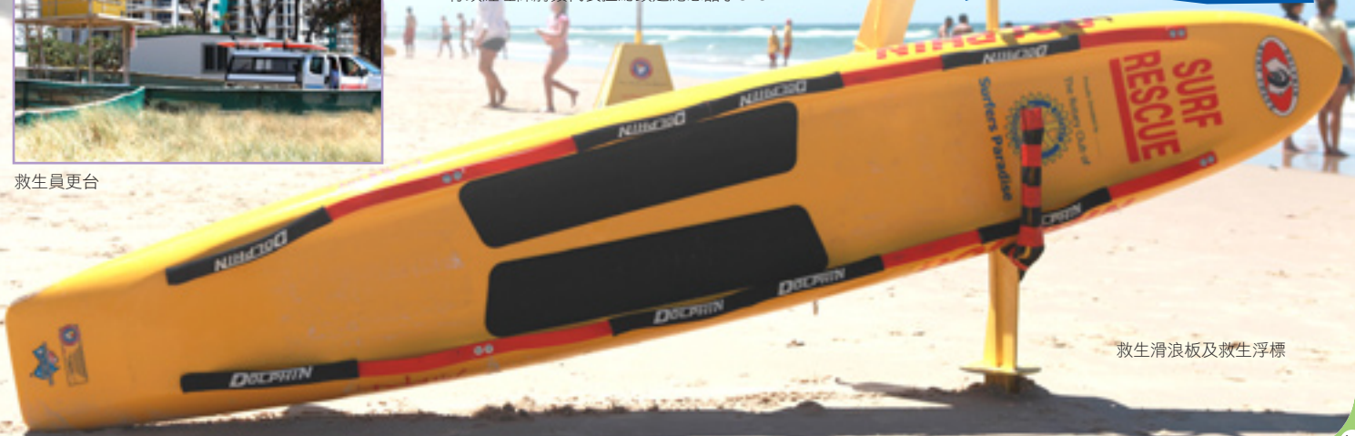
救生滑浪板及救生浮標