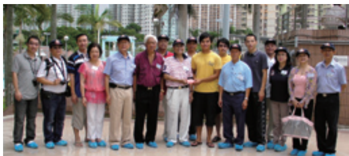
顯田游泳池 - 藍鯨拯溺會